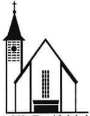
Zur Hl. Dreifaltigkeit