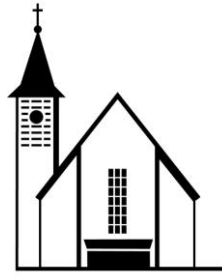
Zur Hl. Dreifaltigkeit